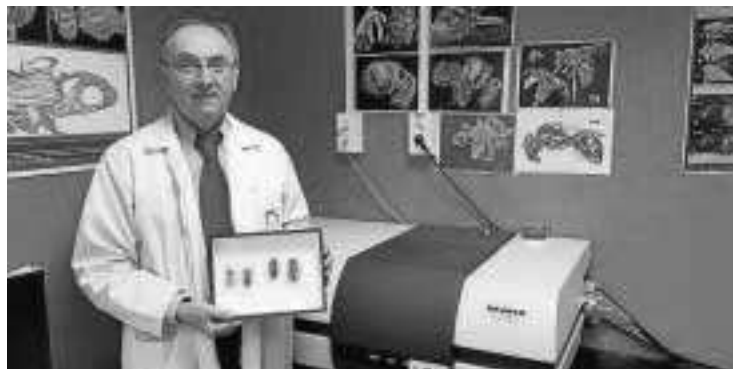
El profesor de la UGR posando en su laboratorio de imagen.

la productora BUF. También se precisó el escaneo de una especie de escarabajo de la familia tenebriónidos ( Zoophobas morio ).